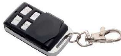
Emisor llavero CROSS CROSS keychain transmitter Émetteur clé CROSS MINI keychain transmitter Emisor de lhaveiro CROSS