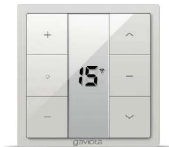
Emisor pared 15 canales CROSS CROSS 15 channels wall transmitter Émetteur mural 15 canaux CROSS Trasmittitore parete 15 canali CROSS Emisor de parede 15 canais CROSS