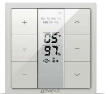
Reloj programador CROSS CROSS clocked transmitter Horloge programmable CROSS Programmatore orario CROSS Relógio programador CROSS