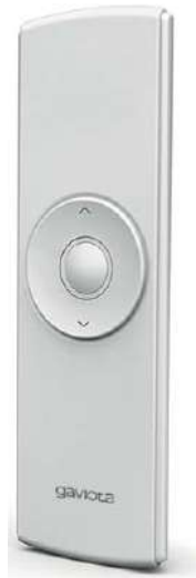
Emisor 1 canal CROSS CROSS 1 channel remote control Émetteur 1 canal CROSS Trasmittitore 1 canale CROSS Emissor 1 canal CROSS

Emisores compatibles • Compatible transmitters Émetteurs compatibles • Trasmittitori compatibili • Emissores compatíveis