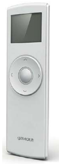
Emisor 15 canales CROSS CROSS 15 channels remote control Émetteur 15 canaux CROSS Trasmittitore 15 canali CROSS Emissor 15 canais CROSS