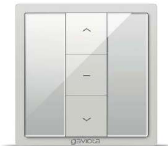
Emisor pared 1 canal CROSS CROSS 1 channel wall transmitter Émetteur mural 1 canal CROSS Trasmittitore parete 1 canale CROSS Emissor de parede 1 canal CROSS